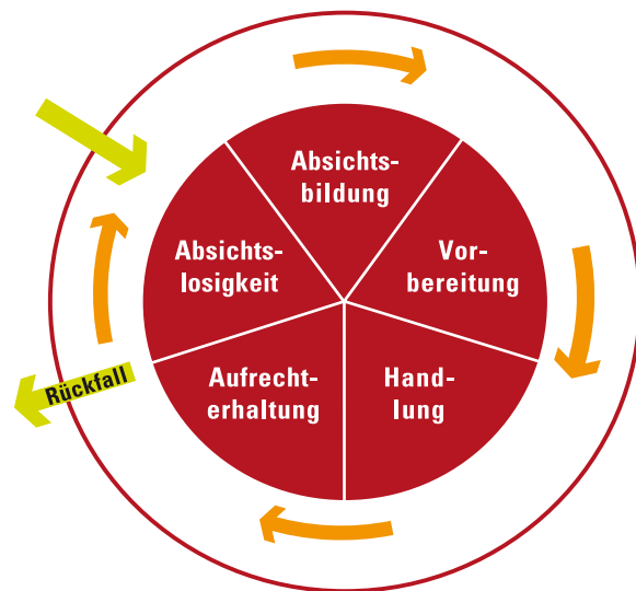
Stadien der Änderungsbereitschaft

Spontanremissionen werden auf circa fünf Prozent geschätzt. Unbehandelt nimmt die Krankheit häufig einen chronisch progredienten Verlauf, der oft der Beschreibung des „protrahierten Suizids“ entspricht. So ist die Lebenserwartung von Alkoholkranken gegenüber Gesunden um durchschnittlich 15 Jahre verringert. Ebenso ist die durchschnittliche krankheitsbedingte Frühverrentung bei Nichtbehandlung um 12–15 Jahre vorverlegt. Suizidversuche und vollendete Suizide sind bei Alkoholkranken häufig.